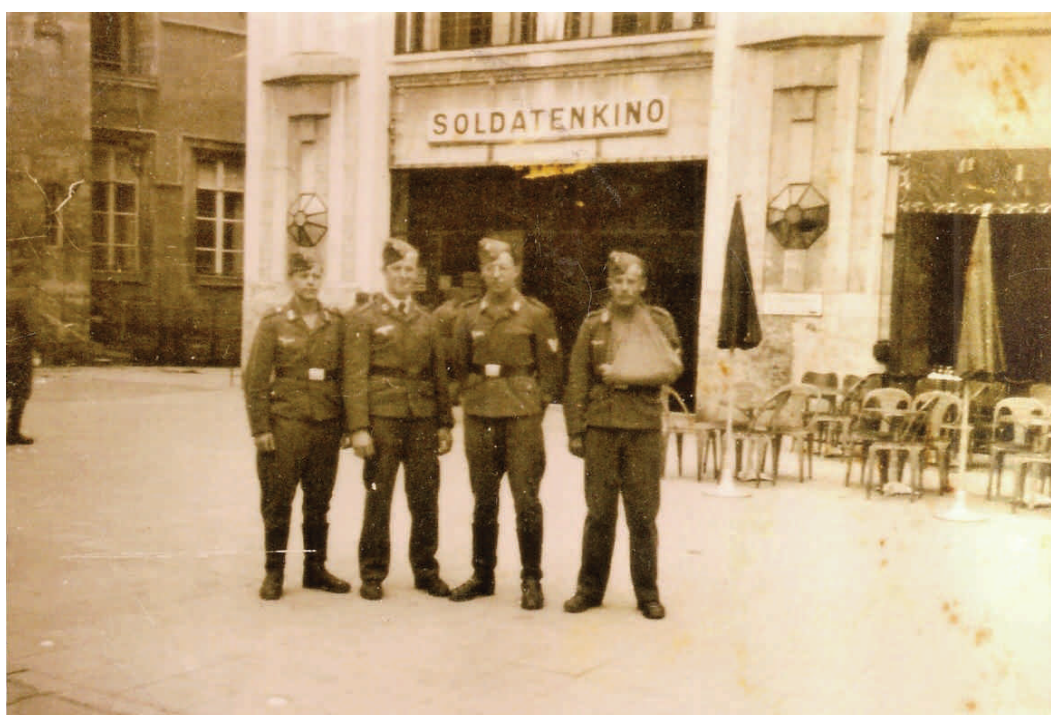
Cinéma Majestic à l'époque