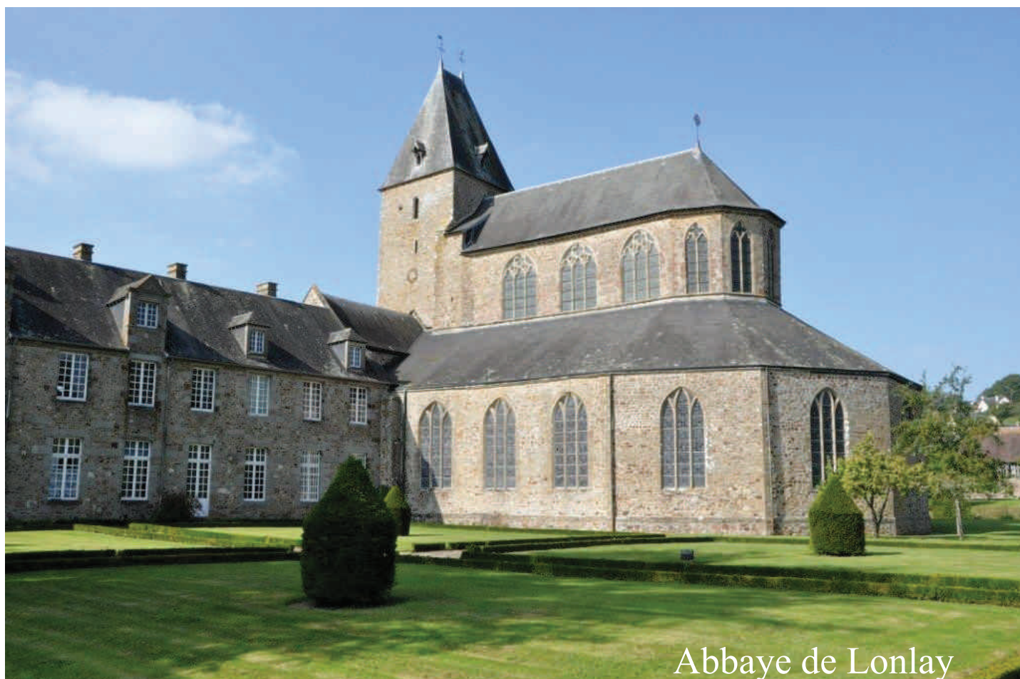
Abbaye de Lonlay