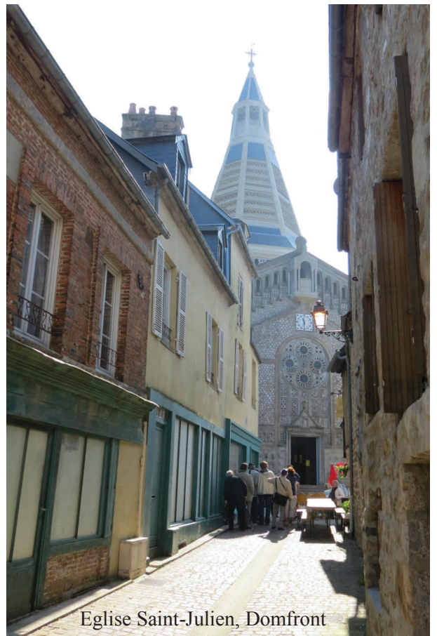
Eglise Saint-Julien, Domfront