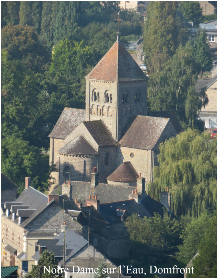
Notre Dame sur l'Eau, Domfront