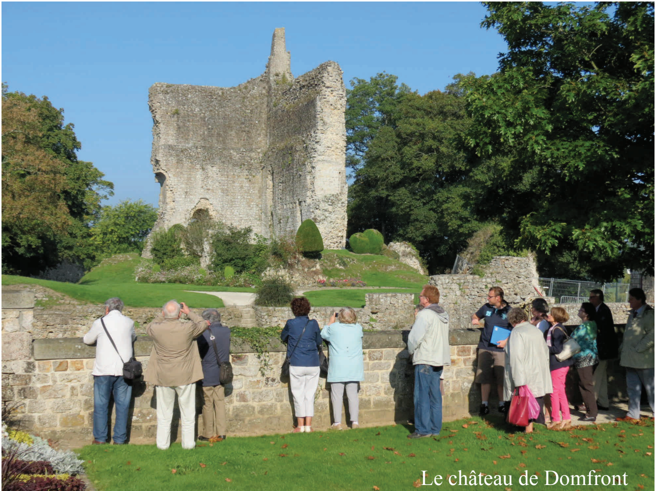
Le château de Domfront